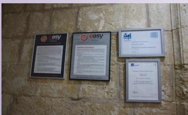
Certyfikaty szkoły „Easy”